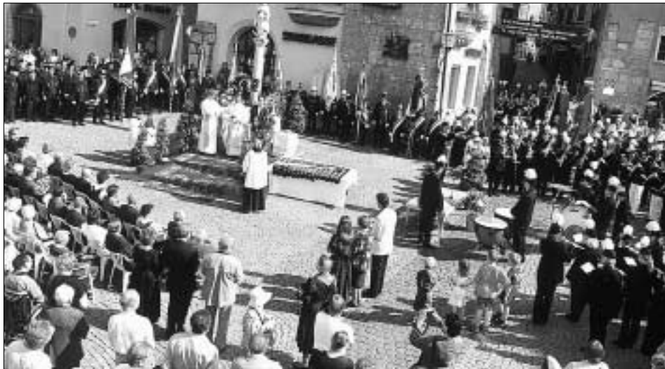
Gemeinsam feierten die Salinenmusikkapellen einen Gottesdienst am Oberen Stadtplatz.