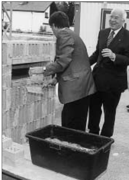
LH van Staa und Bgm. Vonmetz legten den Grundstein für das Wallnöferzentrum.

Landeshauptmann Herwig van Staa und Bgm. Leo Vonmetz griffen zur Maurerkelle und Ziegelstein und wetteiferten im handwerklichen Geschick. Bei der Grundsteinlegung anwesend waren auch zahlreiche Vertreter der Bauträger bzw. der künftigen Nutzer. Neben Privatuniversität, neuem Ausbildungszentrum West (AZW) und Kompetenzzentrum (HITT) wird auch ein Studentenheim errichtet. Bereits mit dem Wintersemester 2004 soll der Universitätsbetrieb in Hall aufgenommen werden.