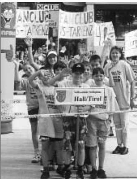
Die Klasse der Volksschule am Stiftsplatz...