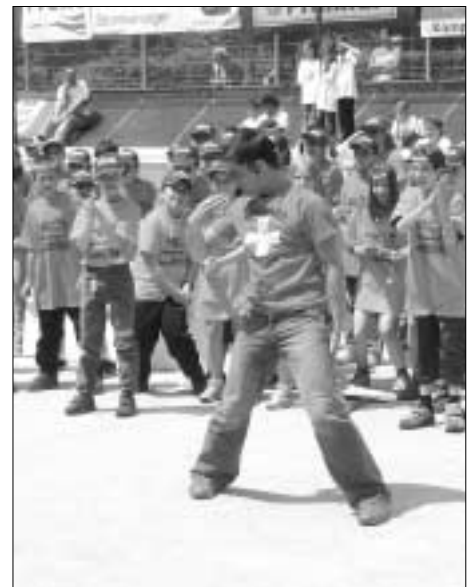
Moderator Andreas gab ordentlich Gas.