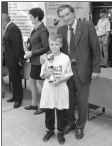
... erkämpfte sich Platz sieben.