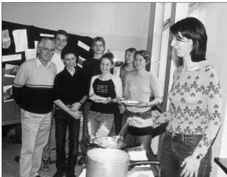
Brennsuppe als „Vernissage-Buffer“ der anderen Art bei der Ausstellungseröffnung im Franziskanergymnasium.