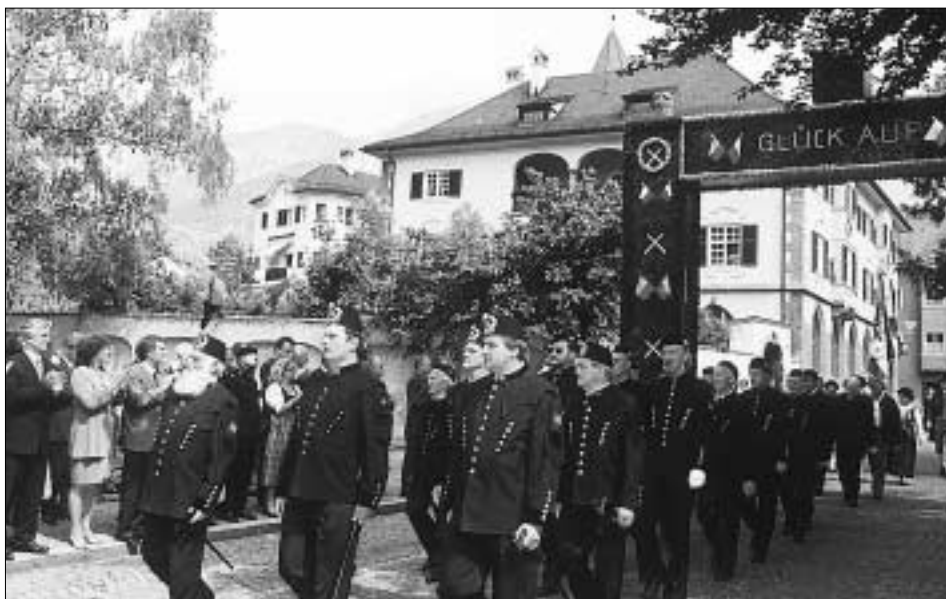
Auch Halls ehemalige „Bergler“ trugen ihre Festtracht, viel Beachtung fand auch das aufwändig geschmückte Ehrentor.