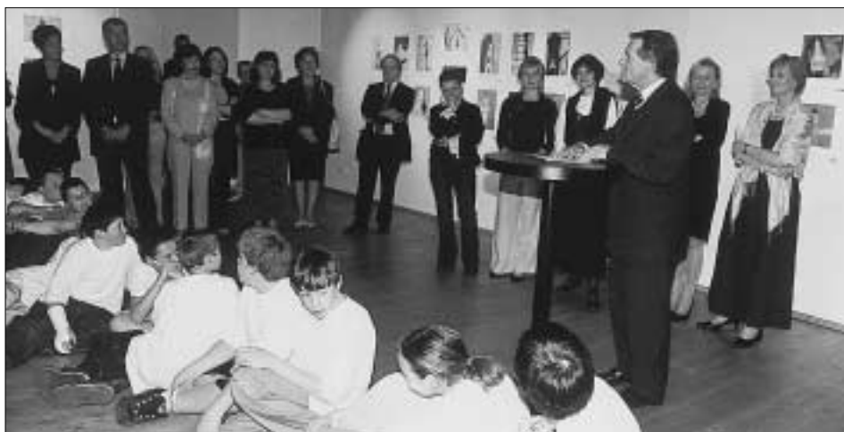
In wunderschönen Galerieräumen konnten die Haller SchülerInnen ihre Werke präsentieren.