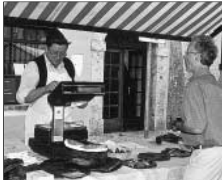
Sich mit biologischen Lebensmitteln gleich beim Bauern einzudecken – Qualität pur.