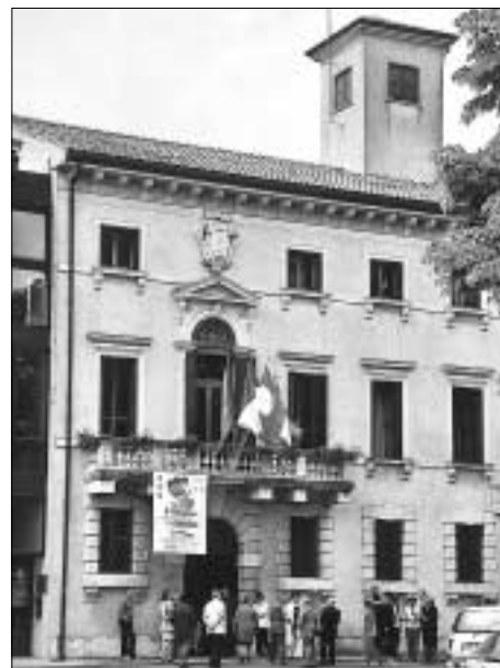
Repräsentativ: das Rathaus von Sommacampagna.