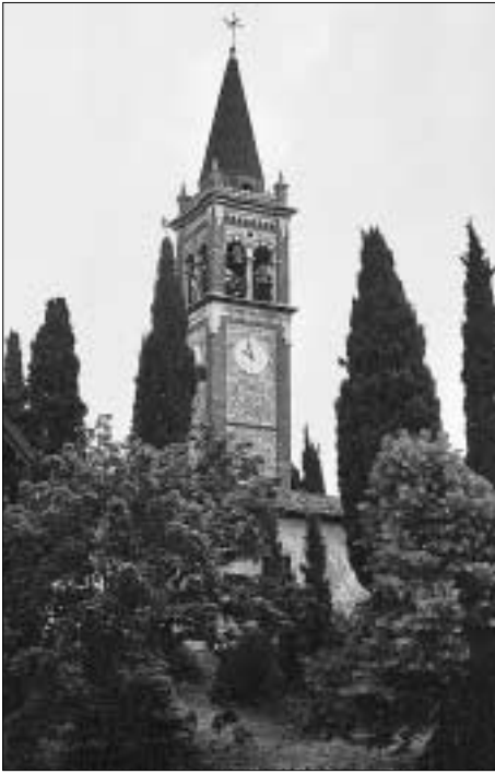
Architektonische Schönheiten gibt es zahlreich im Somacampagna.