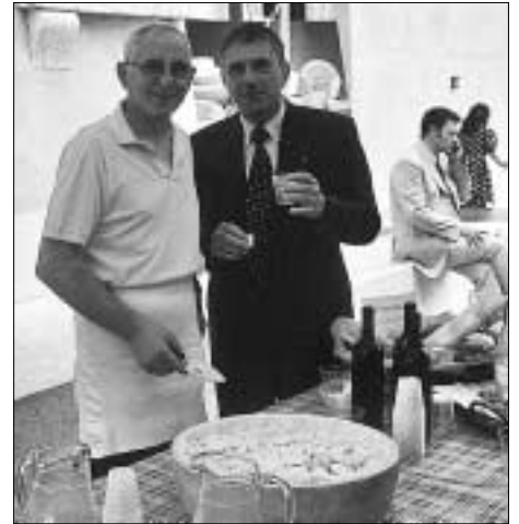
Italienische Köstlichkeiten wurden reichlich aufgetischt...