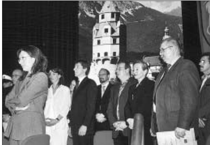
Zahlreiche Stadt- und Gemeinderäte von Hall waren bei den Partnerschaftsfeiern in Sommacampagna dabei.