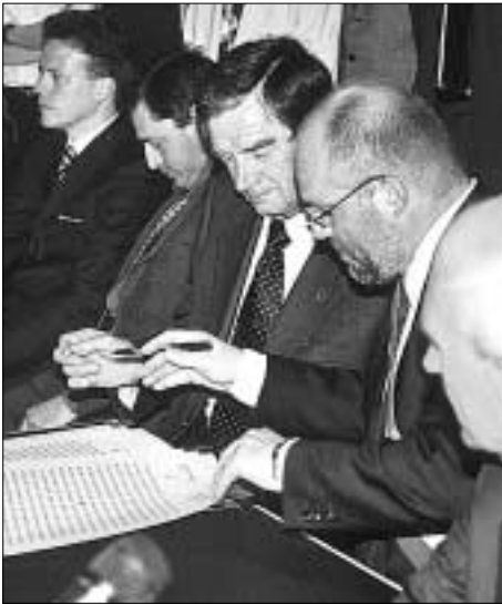
Bei der feierlichen Unterzeichnung der Partnerschaftsurkunde.