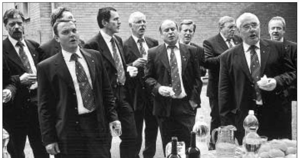
Immer wieder stimmte der Männergesangsverein ein Lied an – hier z.B. im malerischen Garten des Rathauses von Sommacampagna.