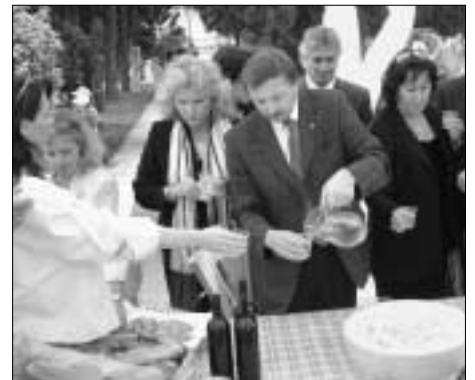
... und auch der Bianco di Custoza floss in Strömen.