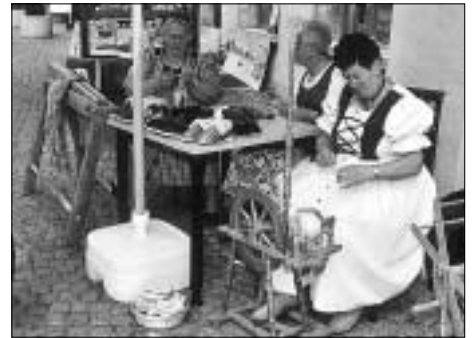
Fleißige Hände mussten Bäurinnen zu allen Zeiten haben.

Auch das bunte Rahmenprogramm gefiel sichtlich, Spitzenrenner – zumindest beim sehr jungen Publikum – war der Streichelzoo u.a. mit einem Lama im Altstadtpark.