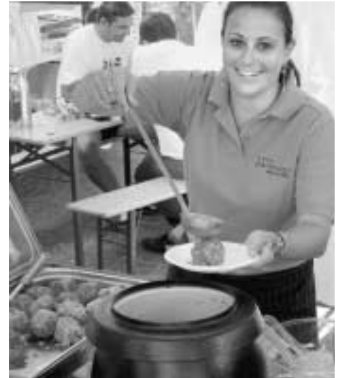
Am Samstag ist in Hall Knödeltag!

Veranstaltet wird das Knödelfest vom TVB Region Hall-Wattens, Abteilung Stadtmarketing, in Zusammenarbeit mit der Haller Gastronomie.