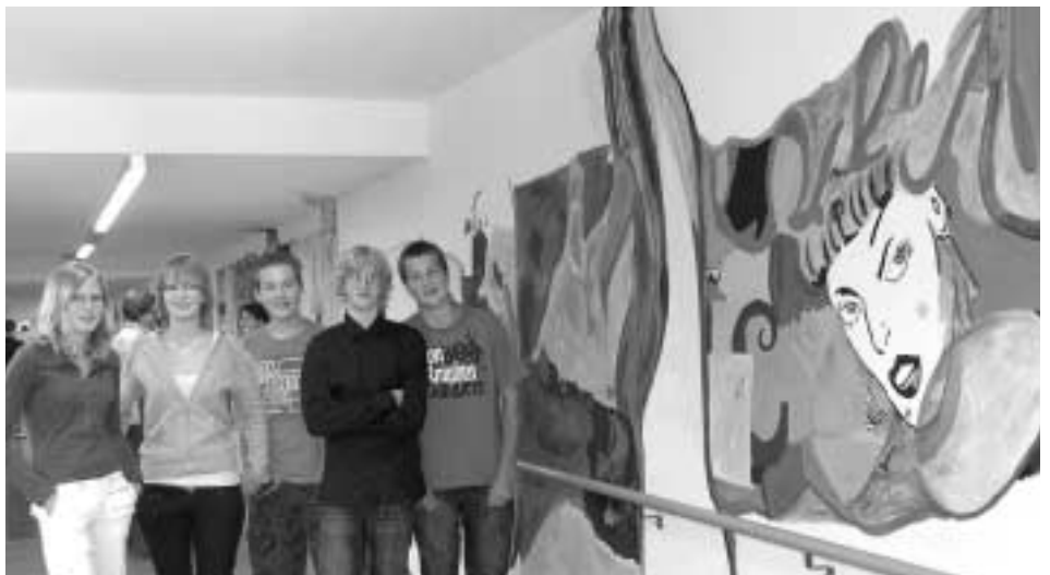
Stolz auf ihr Werk: SchülerInnen, die im Wohn- und Pflegeheim zum Pinsel gegriffen haben.