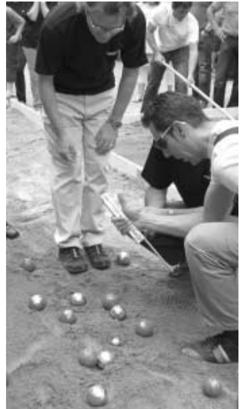
Im Dauereinsatz: Der Meterstab, mit dem genauestens nachgemessen wurde