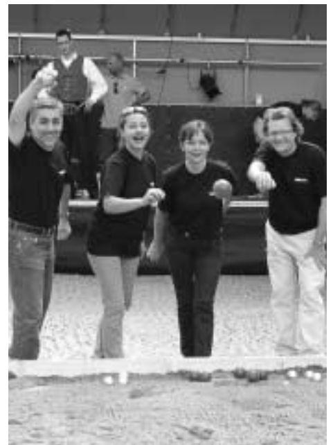
Mit viel Einsatz dabei: Das Team der Kaufleute, leider reichte es nur für den letzten Platz.