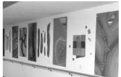
Ein unpersönlicher kahler Gang wurde zu einem bunten Weg.

Mutter, die im Haus im Stiftsgarten lebt, durch diesen Gang – einfach herrlich!“