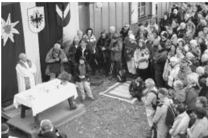
350 Bergfreunde waren zur Bischofsmesse auf den Glungezer gekommen.

Zum Jubiläum schenkte der Altbischof dem Haller Alpenverein noch ein Bild, auf dem er den Glungezer in seinem unverwechselbaren Malsstil festgehalten hat.