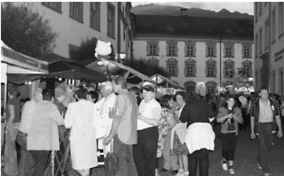
Gutgelaunte Besucher strömten zum zweitägigen Haller Stadtfest.