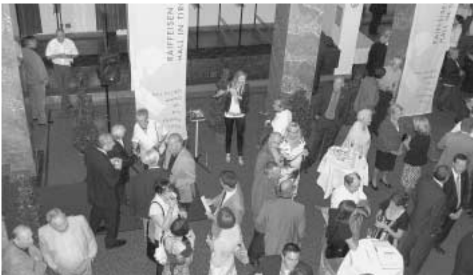
Vor der Generalversammlung gab es einen Aperitif im Foyer des Kurhauses