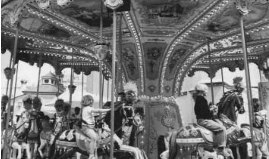
Das Haller Stadtfest zeichnet sich auch durch ein buntes Kinderprogramm aus.

Auch beim 9. Haller Stadtfest wird das Festmotto „gemeinsam feiern“ zum roten Faden, der sich durch das zweitägige Fest zieht. Bgm. Leo Vonmetz wird das Fest am Freitag, 3. Juli, um 18 Uhr am Oberen Stadtplatz eröffnen