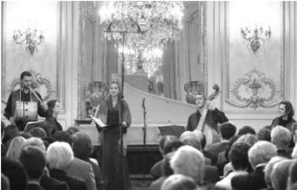
Das Ensemble „Les Musiciens de Saint Julien“ gastiert am 26. Juni in der Haller Jesuitenkirche

traditionelle Musik des Barock. Im 17. und 18. Jahrhundert waren die „Brunettes“ sehr populär. Liebe und das Leben der Landbevölkerung sind darin Thema, was der beliebten Schäfermode des 17. und 18. Jahrhunderts entsprach. Die „Noblen“ hatten die Lust am „einfachen Leben“ entdeckt, die Revolution bereitete sich vor, und mit Rousseau war man erstmals in der Geschichte etwas „grün“.