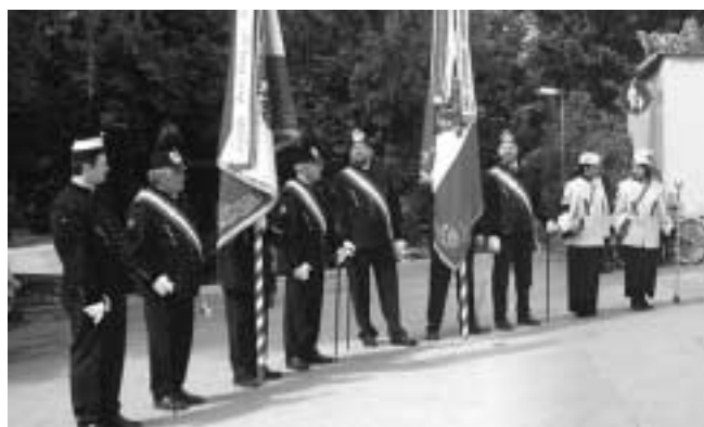
Die Kameradschaft der ehemaligen Salinenbediensteten bewahrt ein wichtiges Stück Tradition