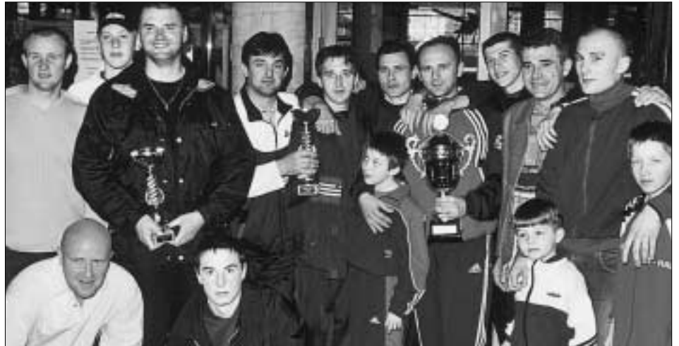
Die Jungbauern Heiligkreuz und des FC Sloga Hall hatten besonderen Grund zur Freude

1. FC Sloga Hall • 2. Streetwork Hall • 3. FC Crocodiles • 4. Türkische Jugend Hall • 5. FC Kroatia • 6. FC Club 84 • 7. FC Silo Jet • 8. FC Genclerbirgii