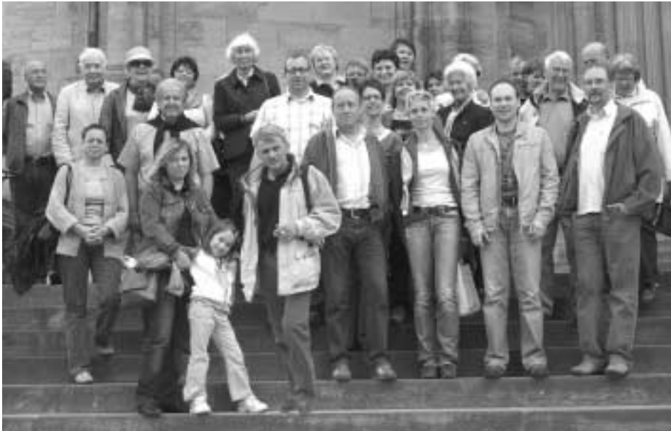
Erinnerung an eine interessante Reise der Numismatiker: Gruppenfoto vor dem Bamberger Dom