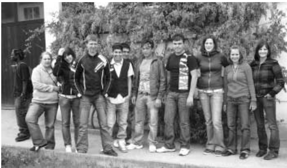
SchülerInnen der Schule am Rosenhof und der HSFS Kematen führten gemeinsame Projekttag durch.