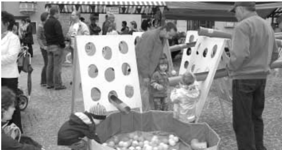
Am Samstag präsentieren sich wieder viele Institutionen rund um das Thema Familie

Zusätzlich unterhält die kleineren Besucher das engagierte Betreuersteam des Spielbusses der Katholischen Jungschar mit tollen Spiel- und Bastelmöglichkeiten. Der Kindergarten Grillenbichl wird Naturerfahrungen für Kinder bieten, sie können sich durch Fühl- und Tastkisten neue Sinneseindrücke holen und sogar ein Stück Wald mit nach Hause nehmen. Bei einem Glücksrad gibt es nicht nur Gewinne, die Kindern Spaß machen, der Kath. Familienverband / Zweigstelle Hall und der Verein Aktion Tagesmütter / Zweigstelle Hall werden dabei die Eltern auch über flexible, kindgerechte Betreuungsangebote informieren. Spezielle Information und Beratung über das Angebot für werdende Mütter, Mütter mit Säuglingen und Kleinkindern gibt die Landes-sanitätsdirektion mit der Mutter-Eltern-Beratung beim Familientag. Sich einen eigenen Button holen und an der Schminkstation von professioneller Hand verwandeln lassen, können sich die Kleinen bei den Kinderfreunden Hall. Das Haller Jugendhaus park in wird sein umfangreiches Sommerprogramm präsentieren. Ob Hüttenwochenende, Klettern, Schwimmausflug, Fahrten zu anderen Skate- und BMX-Parks, Abwechslung und Action ist garantiert. Weiters gibt es beim Familientag Infos zum Job-Coaching Projekt. Weiters werden sich beim Haller Familien-Info-Tag vorstellen: die Pfadfindergruppe Hall, die Jungschar der Pfarre Hall St. Nikolaus und die Speckbacher Jungschützen.