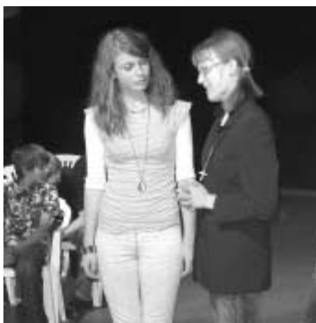
UP-2-DATE laden zum Theaterabend ins TPZ