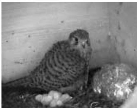
Drei Junge werden von der Falkenmutter betreut

Am Pfingstwochenende sind in der Burg Hasegg drei kleine Falken geschlüpft. Der Muttervogel schützt die Kleinen vor Witterungseinflüssen, dieses sogenannte Hudern wird etwa neun Tage dauern und während dieses Zeitraums füttert ausschließlich die Mutter die Jungvögel. Danach werden sie sowohl vom Vater als auch von der Mutter gefüttert. Ab der dritten Woche werden die Jungfalken versuchen, selbständig zu stehen und mit Ende der vierten Lebenswoche sollte der Wechsel vom Daunenkleid zum Gefieder vollzogen sein. Danach werden sie bald flügge und verlassen das Nest.