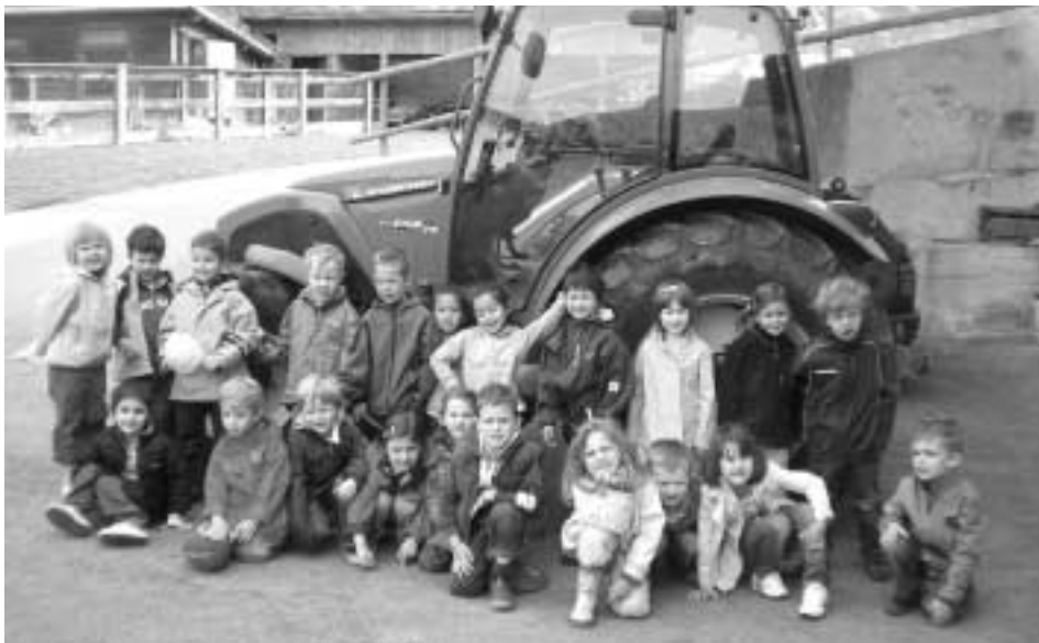
Ein Besuch auf dem Bauernhof ist für Stadtkinder immer eine spannende Sache.

Das gefiel den Kindern ganz besonders und sie sagten auf diesem Weg ein großes Dankeschön an die Bäurinnen Burgi, Annemarie und Hildegard für die herzliche Aufnahme!