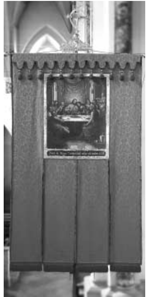
Die Metzgerfahne aus dem Jahr 1836 wurde fachgerecht restauriert

Sind es heute die Innungen, so waren es in früheren Zeiten die Zünfte, in denen sich Gewerbetreibende zum Nutzen und Vorteil aller zusammengeschlossen haben. Besonderes Augenmerk lag neben den fachlichen und rechtlichen Erfordernissen auf dem sozialen Bereich. Als äußere Zeichen gab es u.a. Zunftstangen und Zunftfahnen, sie wurden von den Brudermeistern und den „Knechten“ (Gesellen) ge-