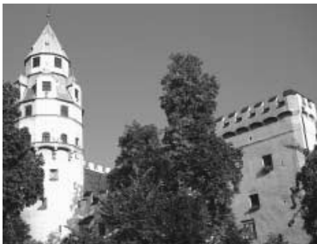
Burg Hasegg mit Münzerturm

Ich darf nun an dieser Stelle einer Reihe von Personen einen ganz herzlichen Dank aussprechen. Ohne sie wäre dieses Ausstellungsprojekt nicht zu verwirklichen gewesen. Vor allem nicht in so kurzer Zeit und in so ansprechender Qualität.