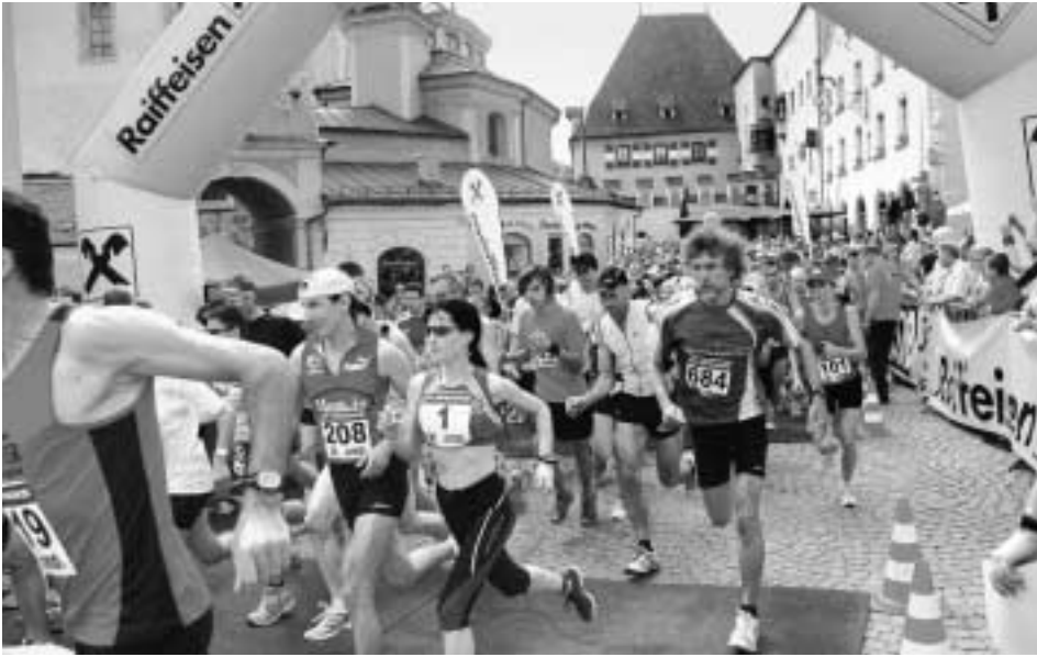
Über 600 Laufbegeisterte waren am Oberen Stadtplatz an den Start gegangen.

Einen regelrechten Massenstart gab es am vergangenen Samstag beim bereits 3. Raiffeisen Halbmarathon Hall-Wattens. Über 600 TeilnehmerInnen nahmen die Herausforderung an und sorgten für einen spannenden Lauf, der sich auch durch großes Publikumsinteresse auszeichnete.