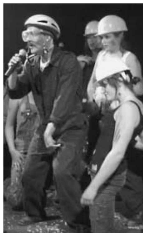
Kontestsieger „Safety Land“

In diesem kleinen Freistaat wird Sicherheit so groß geschrieben, dass es nicht einmal eine Hauptstadt gibt, weil bekanntlich große Menschenansammlungen potentielle Gefahrenherde darstellen. Umso bewundernswerter, dass die charmante Combo unter Auflage sämtlicher Brandschutzbestimmungen vor der gläubigen Gemeinde von Reverend Randy Mamola auftrat, die das Stromboli fast zur Gänze ausfüllte. Den Weg ins Paradies nur knapp verfehlten die Astronauten aus Magyaroszá, das Kazoo-Orchestra aus Monaco, Peter, Heidi und der Rest der Familie aus der Schwyz sowie die „Wintakerschn“ aus dem Land der Berge.