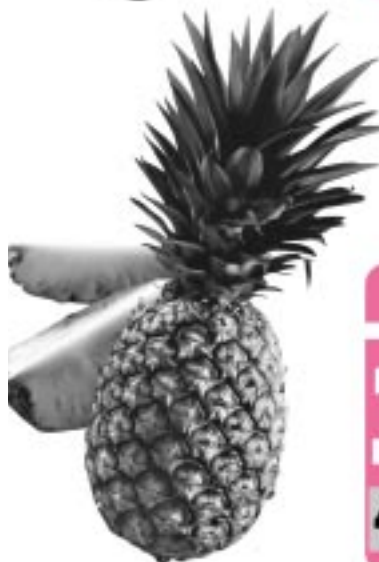
Dole Ananas aus Costa Rica "Extra Sweet" 1 Stück