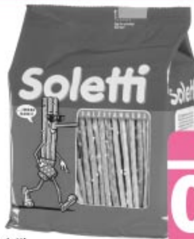
Soletti Saltzstangerl 250-g-Familienpackung