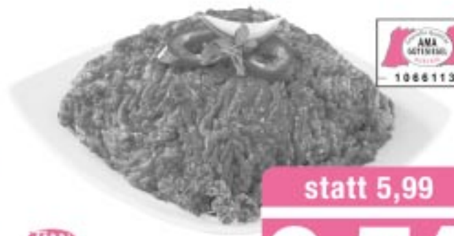
TAN Frisches Faschiertes gemischt aus Rind- und Schweinefleisch aus Österreich per kg