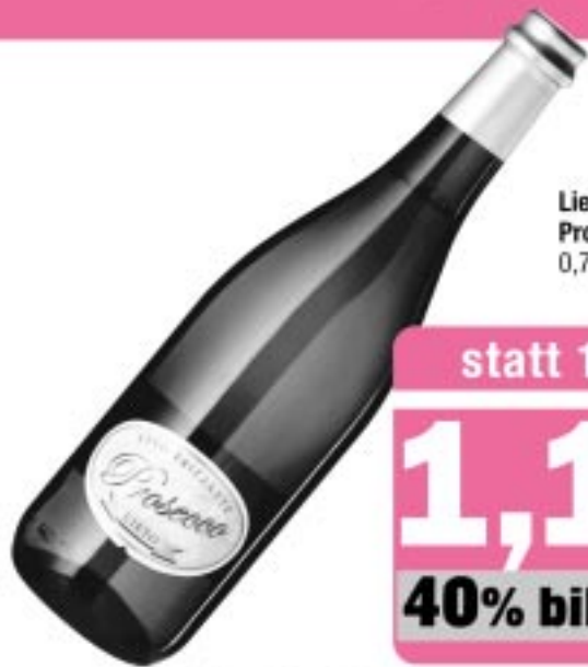
Lieto Prosecco Verde 0,75 Liter