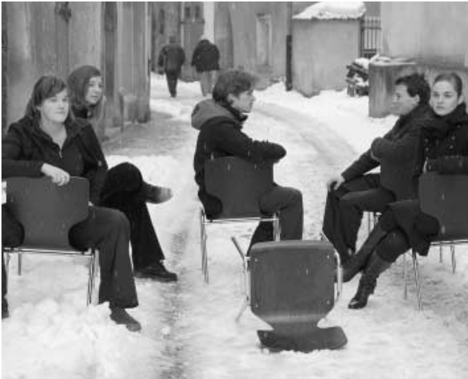
Das junge Theaterensemble lädt zur Premiere am Freitag ins Lobkowitzgebäude