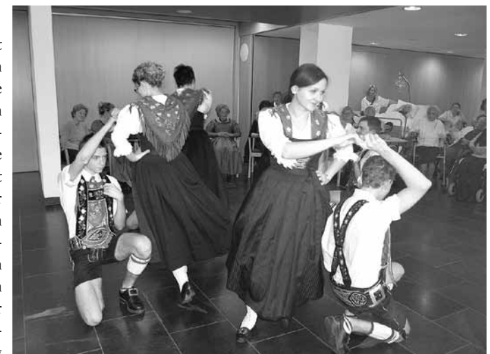
Viel Applaus bekamen die Thaurer Trachtler