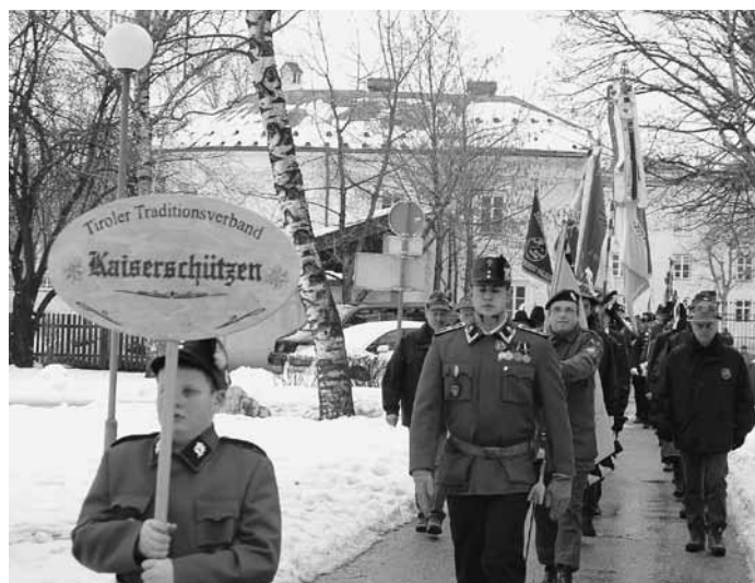
Zahlreiche Fahnenabordnungen waren zum Traditionstag des Tiroler Traditionsverbandes nach Hall gekommen.