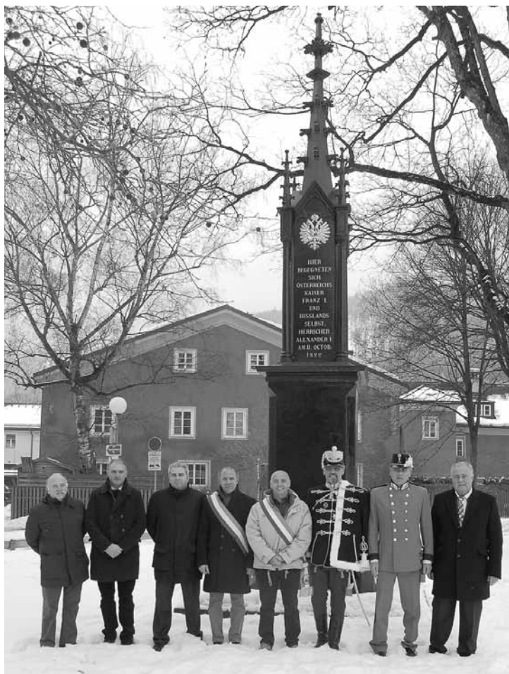
Kulturstadtrat Hans Tusch (ganz re) mit den Ehrengästen vor dem Kaiserdenkmal im Salinenpark

Der Präsident des Tiroler Traditionsverbandes, ÖKR Major Klaus Wittauer, konnte zum Traditionstag zahlreiche Ehrengäste, darunter auch den Kulturlandesrat der Provinz Trient, Franco Panizza, in Hall begrüßen.