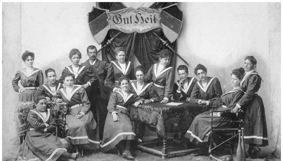
Die "Frauenriege" des Turnvereins Hall 1862 gab es ab der Jahrhundertwende.

In der nächsten Ausgabe der Stadtzeitung lesen Sie über die aktuellen Angebote des Vereins.