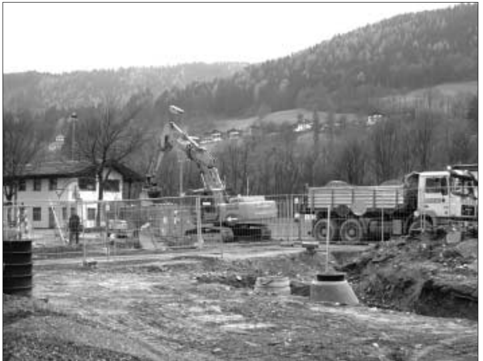
Leitungen, Kanal, Kabel und Straße müssen verlegt werden für den Tribünenbau.

Die Kosten für dieses neue Tribünengebäude am Sportplatz Lend werden sich auf ungefähr 1,6 Millionen Euro belaufen, man hat sich seitens des Gemeinderates dafür entschieden, dass hier wieder über die