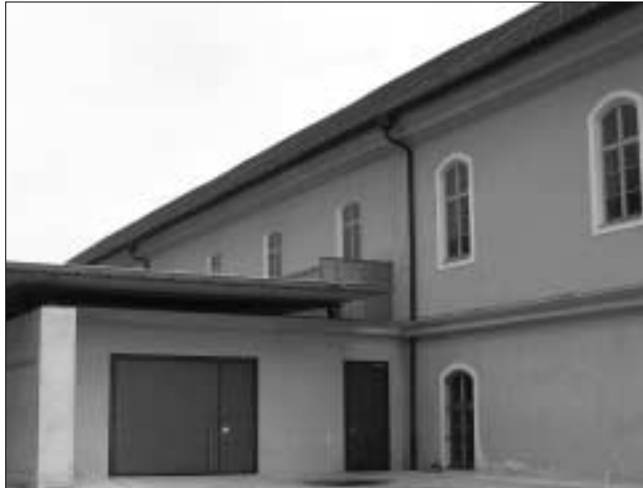
2005 ist die Kunsthalle Schauplatz der Landesausstellung.