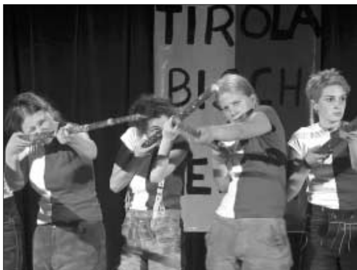
Die Tirolsatire „Tirol isch lei oans“, eine Eigenproduktion der „Haller-Wertesten“, ist am Donnerstag und Freitag im Treibhaus zu sehen.

Aufführungen: Donnerstag 13., und Freitag 14. November, 20 Uhr, im Treibhaus Innsbruck. Eintritt: Jugendliche 5 Euro, Erwachsene 7 Euro.