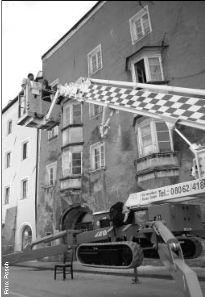
Mit der Fassadenaktion fiel auch der Startschuss für die Revitalisierung der Haller Altstadt.

Darüber hinaus – und das ist wahrscheinlich