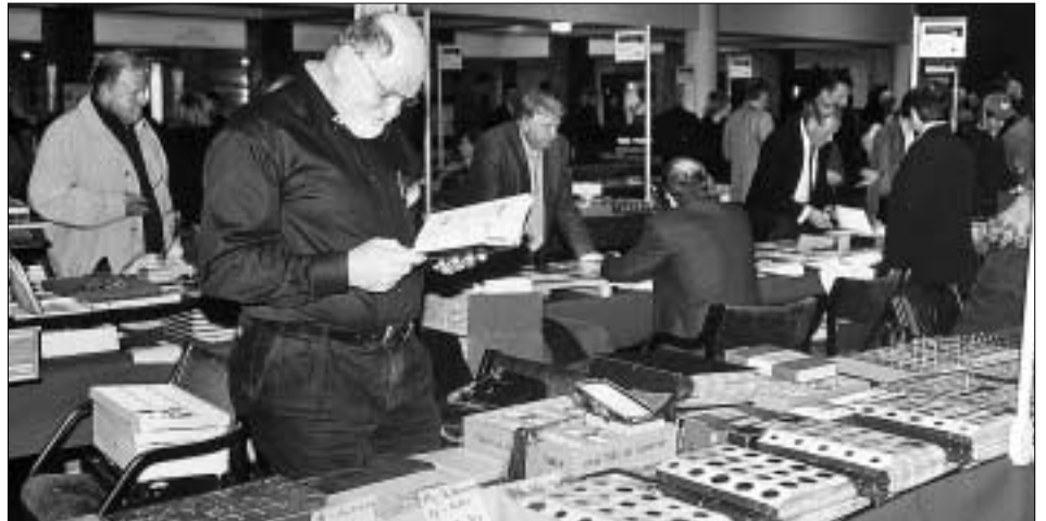
Münzen, wohin man blickte – am vergangenen Sonntag im Kurhaus.

Vergangenes Wochenende wurde Hall mit seiner dritten, von der Tiroler Numismatischen Gesellschaft veranstalteten und von der Stadt Hall und der Hypo-Tirol-Bank unterstützten Münzbörse zum „Mekka“ der europäischen Numismatiker und Münzsammler.