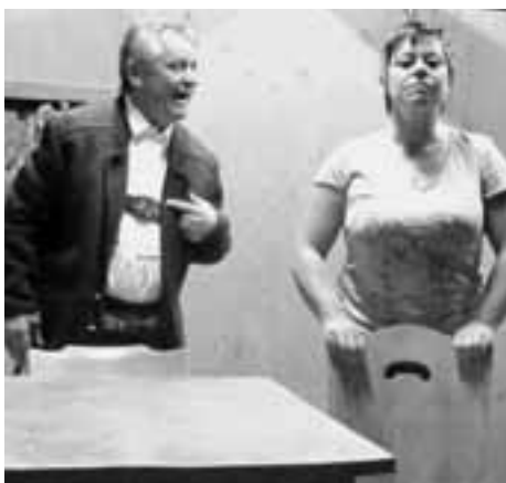
Volkstheater gibt es am Wochenende in Hall.

Im Lobkowitzgebäude wird es am Freitag, 27., und Samstag, 28. Mai, jeweils um 20.15 Uhr gespielt. Karten: 10 Euro. Kartenreservierung unter Tel. 0664 / 513 9507.