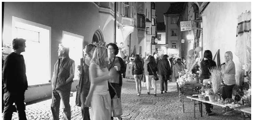
oder wie hier im Bild in der Rosengasse.

Nächtliches Einkaufsvergnügen herrschte beispielsweise in der Agramsgasse ... verabreden zum bummeln, kaufen und amüsieren in der Haller Altstadt.