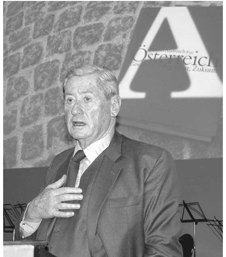
Dr. Hannes Androsch bei der Buchpräsentation im Kurhaus, souverän und charismatisch begeisterte er die Zuhörer.