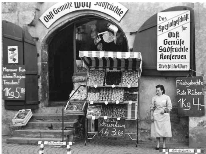
Die Obst- und Gemüsehandlung Wolf in einer historischen Aufnahme.

Die Haller Altstadt versteht sich nicht als Freiluft-Museum, sondern als ein multifunktionaler Ort zum Wohnen und Einkaufen, mit zahlreichen Infrastruktureinrichtungen und mit einem reichhaltigen Kulturleben. Die Altstadt ist zeitgemäßer Nahversorger für seine Wohnbevölkerung und Anziehungspunkt für