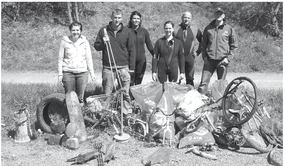
Diese Mengen Unrat und Müll holten die Mitglieder des Tauchvereins aus dem Gießen.

Die Reinigung des Gießens erfolgte dabei nicht nur vom Land her, sondern mit spezieller Ausrüstung auch im Wasser, auf dessen Grund man Absonderliches vom Schafskopf über Fahrräder, bis zu Autoteilen findet. Der Tauchverein hat sich auch der internationalen Kampagne Project Aware Foundation (Aquatic World Awareness, Responsibility and Education) verschrieben. Auch die Förderung des Tauchsportes, um seinen Mitgliedern die Möglichkeit eines regelmäßigen Trainings zu geben, die Verbesserung der körperlichen und geistigen Fähigkeiten, die Förderung der Jugend, die Aus- und Fortbildung von Tauchern, sowie die Ausbildung in Erster Hilfe