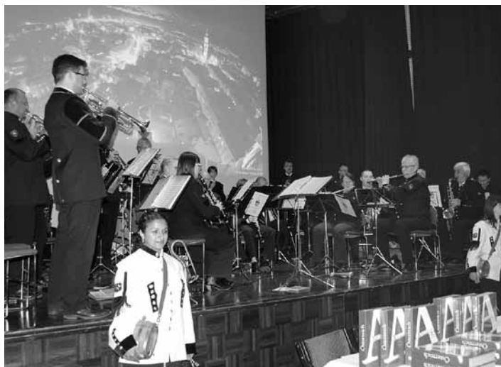
Die Salinenmusik machte den musikalischen Auftakt für die Buchpräsentation

abzustürzen, wie es die Ergebnisse des Pisa-Tests auch fürchten lassen. Wir seien in der absurden Situation, dass die Familie die Erziehung von Kindern an die Schule abgibt, diese wiederum gibt das Unterrichten an die Eltern ab. Eine gute Qualifizierung der Menschen sei jedoch unabdingbar für die Wettbewerbsfähigkeit, appellierte Hannes Androsch. Zum Abschluss der Veranstaltung signierte Dr. Hannes Androsch dann zahlreiche Exemplare seines Buches und verfasste mit großer Geduld auch teils sehr persönliche Widmungen.