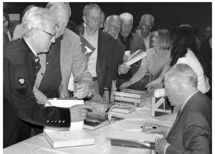
Eine lange Schlange bildete sich, als es galt, signierte Exemplare zu erstehen.