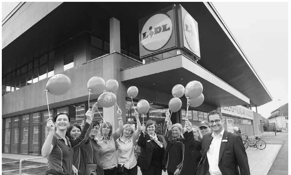
Die MitarbeiterInnen des neuen Lebensmitteldisconters in Hall