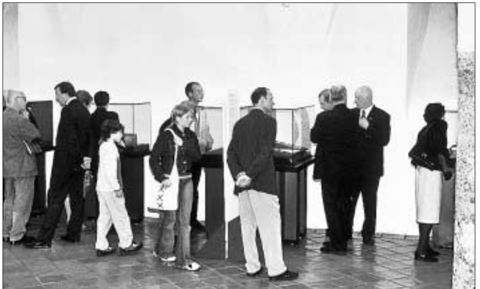
Bei der Eröffnung der Münzausstellung wurden die griechischen Münzen ausgiebig bestaunt.

Das antike Griechenland ist es, das diese Münzschau, die auch in Zusammenarbeit mit der Tiroler Numismatischen Gesellschaft und der Stadt Hall zusammengestellt wurde, selbst für Laien so eindrucksvoll erscheinen lässt. Wer diese Ausstellung besucht, wird anhand der Exponate eintauchen können in die faszinierende Welt des antiken Griechenlands, seine kulturelle Bedeutung und Ausstrahlung auf weite Teile Europas, Kleasiens und Nordafrikas. Die gezeigten Münzen umfassen einen Zeitraum vom 6. vorchristlichen bis zum 4. nachchristlichen Jahrhundert. Figuren und Symbole aus der griechische Mythologie sind wohl die häufigsten Darstellungen auf diesen Münzen,