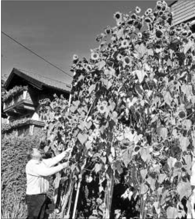
Über fünf Meter hohe Sonnenblumen gedeihen in Hall.