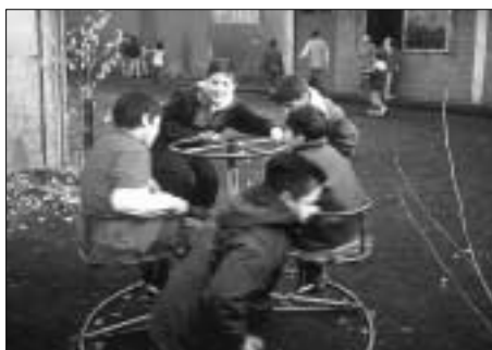
Spielen ist für alle Kinder schön.

In Los Angeles, 500 km südlich von Santiago, lernte ich sehr bald eine andere Realität Chiles kennen. Denn in dem Viertel, in dem ich den Rest meines Einsatzjahres als Missionar auf Zeit verbringen sollte, bin ich anfangs von der materiellen Armut und den einfachen Lebensverhältnissen sehr geschockt. Und dennoch zeigen die Menschen so unglaublich viel Emotionen, Freude mir gegenüber. Ich glaube, dass dieses starke Gefühl von Zusammengehörigkeit, an dem ich mit der Zeit auch teilhaben durfte, den Menschen über so manche Engpässe hinweghilft. Von der Solidarität und Hilfsbereitschaft unter der armen Bevölkerung konnte ich