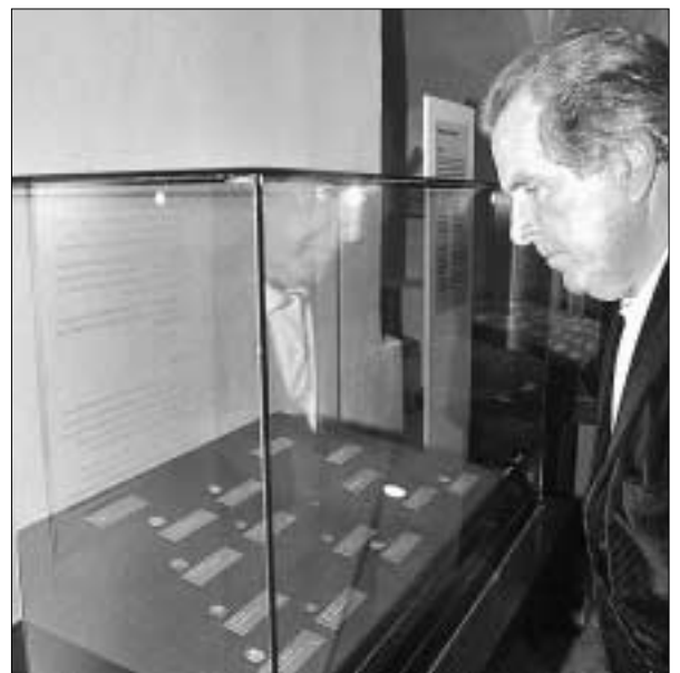
Nicht nur Numismatiker sind von der zeitlosen Schönheit der Münzen begeistert.