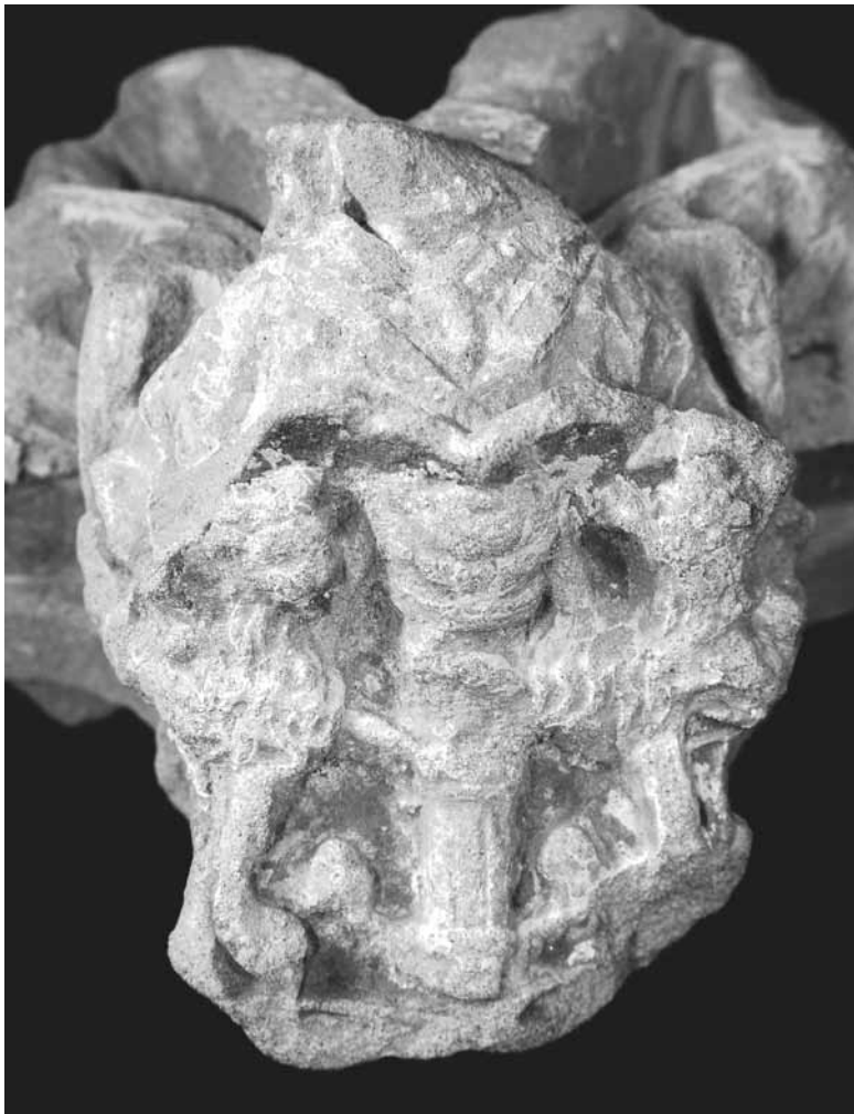
Das Haller Stadtwappen aus dem beginnenden 16. Jahrhundert, Wappenhöhe im Original ca. 5 cm

Im knapp einen Meter hohen Schutt lagen also die Überreste der Wolfgangkapelle. Manche Details der ehemaligen, prunkvollen Ausstattung kamen so wieder ans Tageslicht, etwa Teile der Dachdeckung, bemalte Gewölberippen und gotisches Maßwerk. Und dass sich die Durchsicht auch dieses "Abfalls" lohnte, zeigt ein ganz besonderer Fund: Ein Bruchstück von Fenstermaßwerk zeigt das Wappen der Stadt Hall. Unter der begründeten Annahme, dass es zur Originalausstattung der Wolfgangkapelle von 1505 gehört, ist es – neben ersten Siegeln – die älteste plastische Darstellung des Stadtwappens in seiner Form von 1501. König Maximilian hatte damals dem alten Salzfass noch zwei goldene Löwen beigefügt.